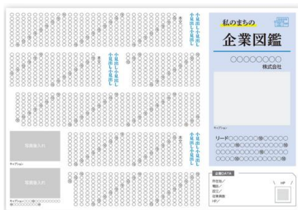
▲『ちいき新聞』記事コーナー掲載イメージ