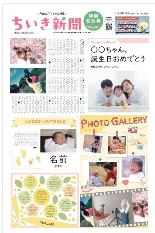
▲「オリジナルちいき新聞」イメージ